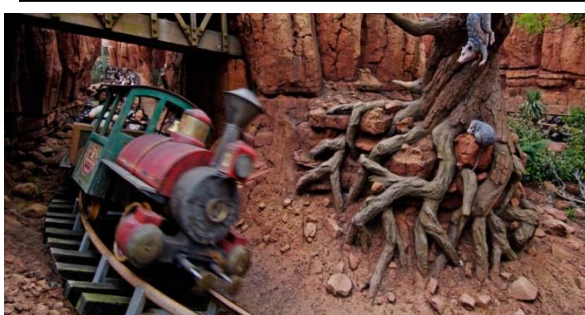
ビックサンダー・マウンテン