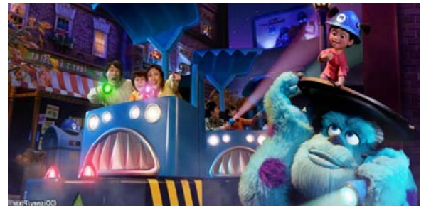
モンスターズ・インク "ライド&ゴーシーク!"