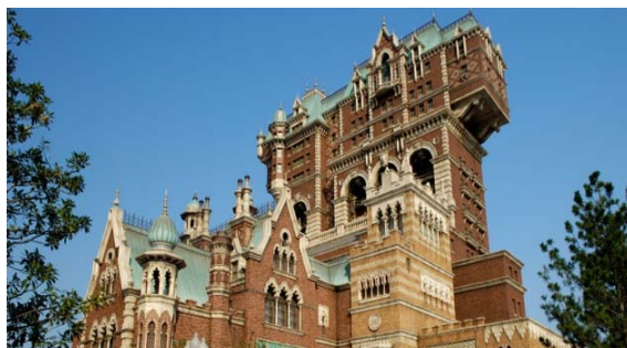
タワー・オブ・テラー