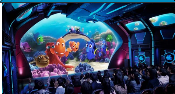
ニモ&フレンズ・シーライダー