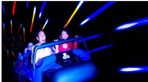
スペース・マウンテン