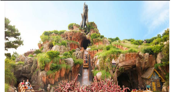
スプラッシュ・マウンテン