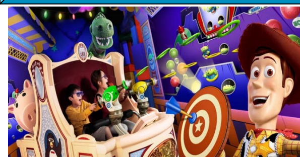
トイ・ストーリー・マニア