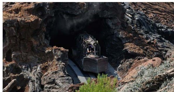
センター・オブ・ジ・アース