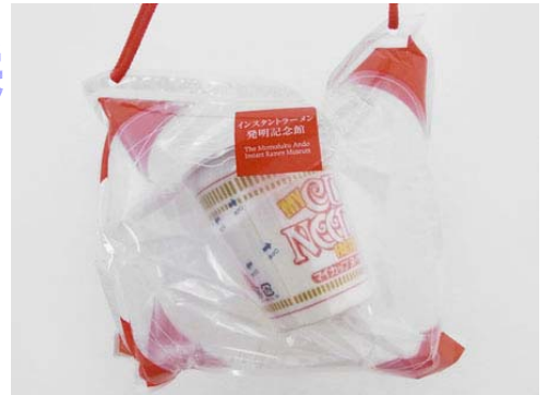
好きな具をいれちゃおう♪