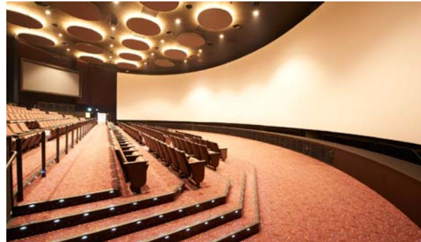
日本最大級のスクリーンで 大迫力の映像を見よう！！