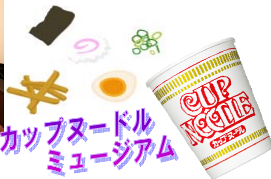
カップヌードル ミュージアム