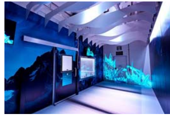
マウントケニアの 極寒体験に挑戦