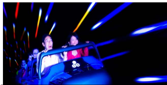
スペース・マウンテン