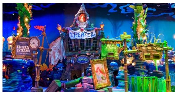
マーメイドラグーンシアター