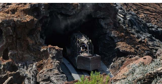
センター・オブ・ジ・アース