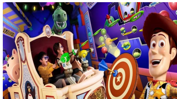
トイ・ストーリー・マニア