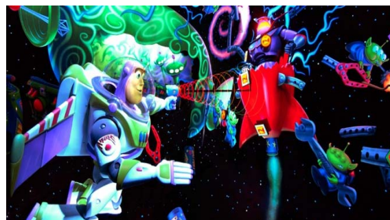
バズ・ライトイヤー