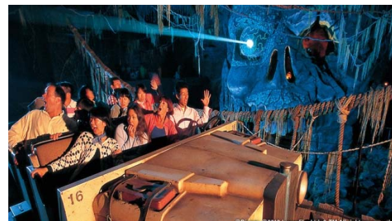
インディアン・ジョーンズ