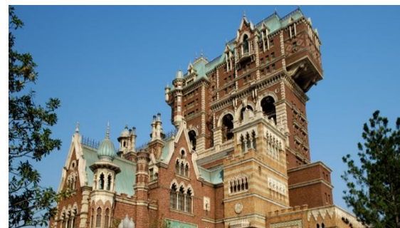
タワー・オブ・テラー