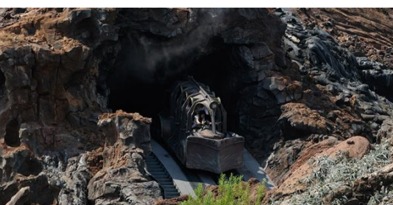
センター・オブ・ジ・アース