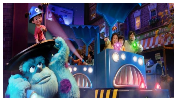
モンスターズ・インク