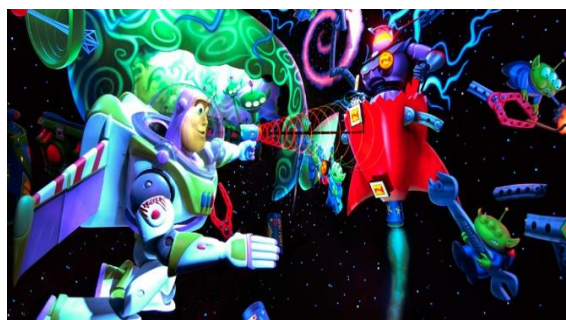
バズ・ライトイヤー