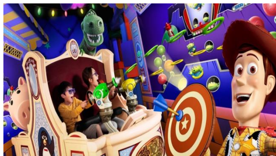
トイ・ストーリー・マニア