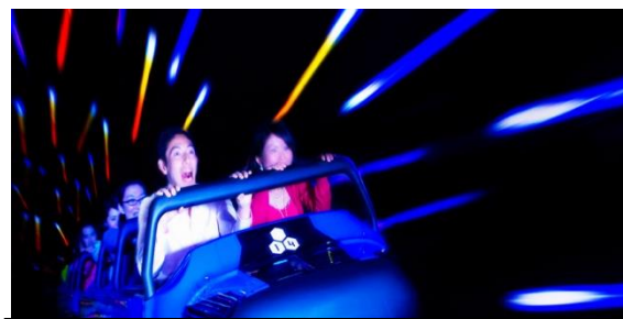
スペース・マウンテン