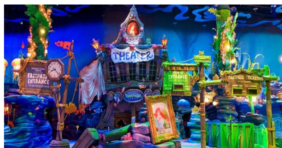
マーメイドラグーンシアター