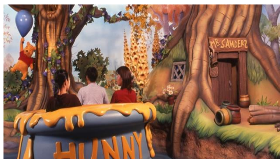
プーさんのハニーハント