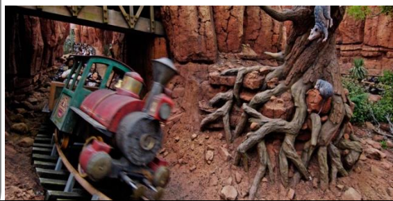
ビックサンダー・マウンテン