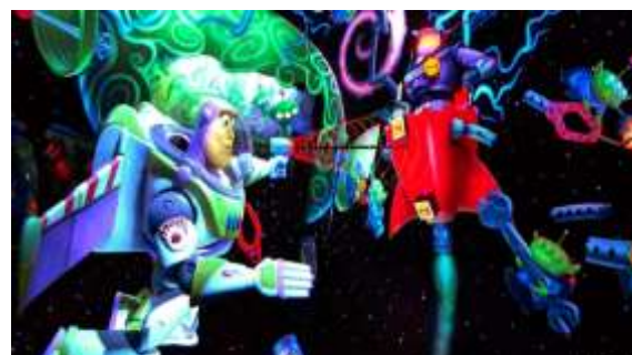
バズ・ライトイヤー