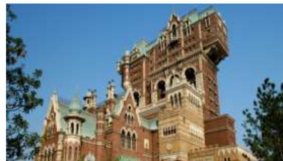
タワー・オブ・テラー