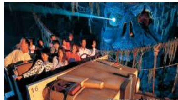
インディアン・ジョーンズ