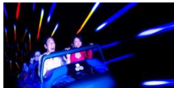
スペース・マウンテン