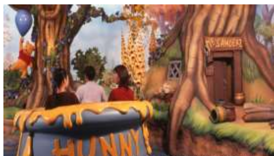
プーさんのハニーハント