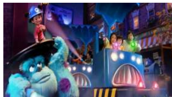
モンスターズ・インク