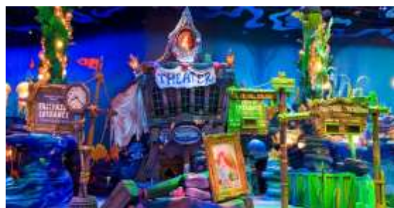
マーメイドラグーンシアター