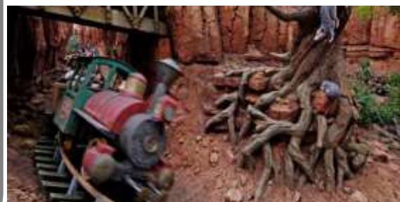
ビックサンダー・マウンテン