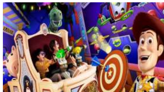
トイ・ストーリー・マニア