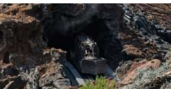
センター・オブ・ジ・アース